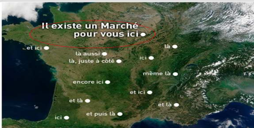
Veille AO pour détecter les marchés